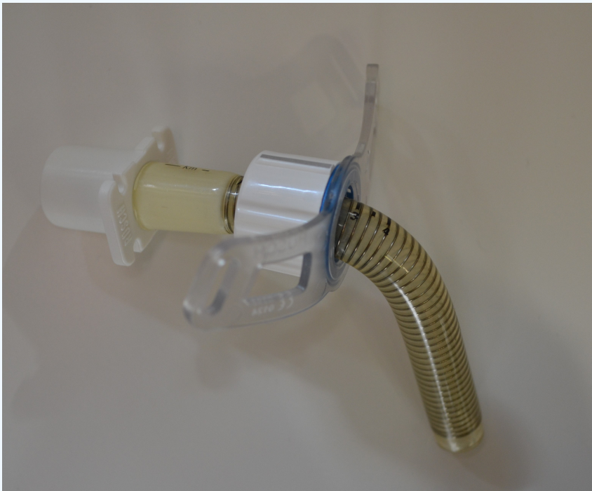
TracheoFlex HC/Rüsch Care