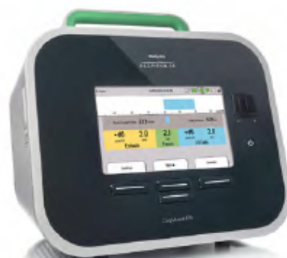
Fa. Philips - Cough Assist E70

CoughAssist E70 ist ein mechanischer In- und Exsufflator, der einen natürlichen Husten simuliert. Dazu wird beim Einatmen – ähnlich wie beim normalen tiefen Einatmen – nach und nach eine große Luftmenge in die Atemwege abgegeben (positiver Druck) und anschließend sofort auf Unterdruck umgeschaltet, damit Sekretauflagerungen aus der Lunge befördert werden (negativer Druck). CoughAssist sorgt für ein wirksameres Abhusten, damit die Atemwege frei bleiben und das Risiko von Atemwegsinfekten reduziert wird.